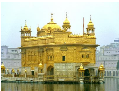
Arany templom (India)