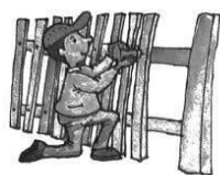
Feri kerítést épít.

A tárgy a cselekvés előtt is létezett, a cselekvés a tárggyal jelölt szóra irányul.