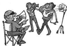
A rendező filmet forgat.