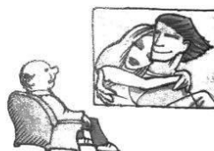
A rendező is megnézte a filmet.

Ebben az oszlopban a tárgy a cselekvés eredményeképpen jön létre, korábban nem létezett.