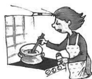
Anyu gulyáslevest főz.