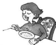
Anyu gulyáslevest eszik.